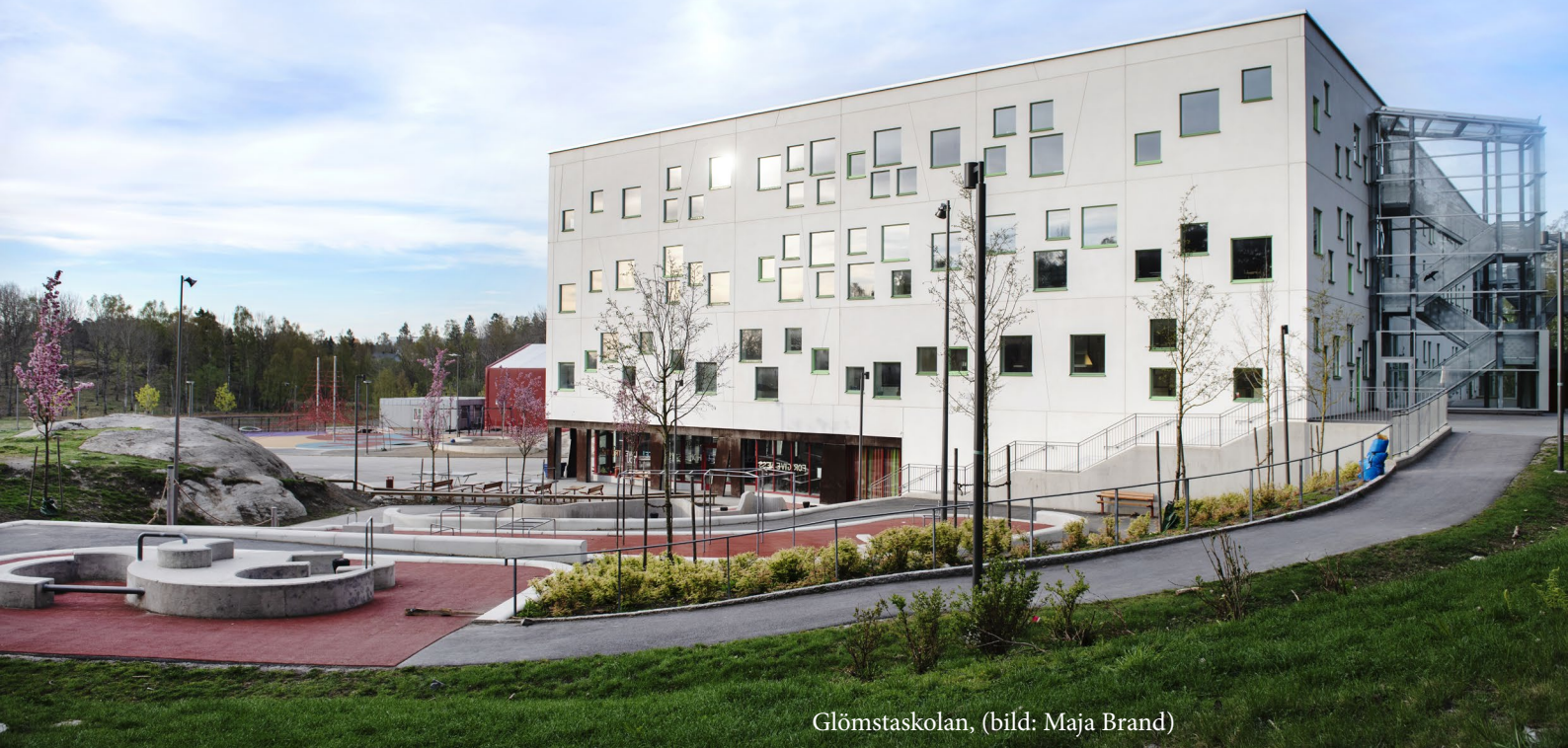
Glömstaskolan, (bild: Maja Brand)