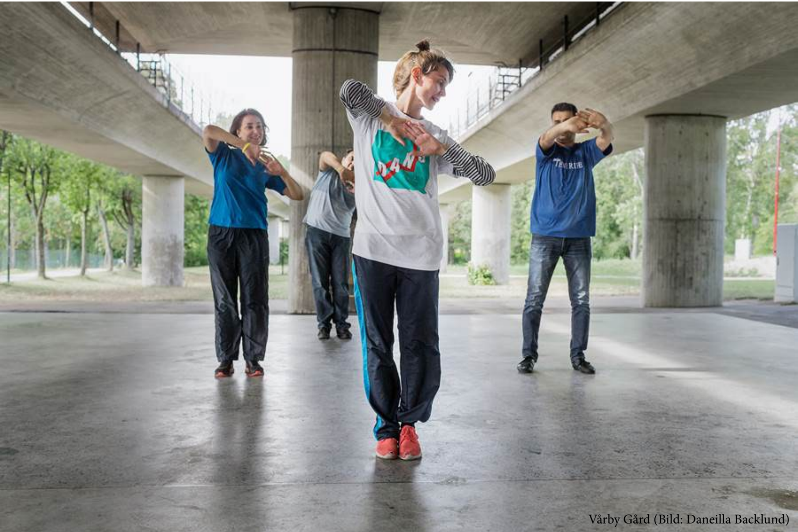
Vårby Gård