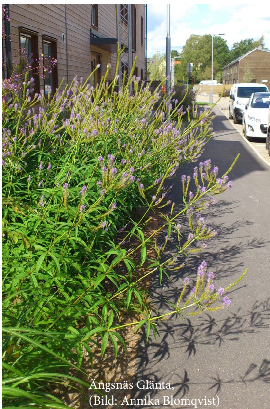
Angsnäs Glänta

I de områden som angränsar till naturmark och de med mindre exploateringsgrad finns möjlighet att arbeta med entréerna till naturreservat och anlägga naturlekplatser. Om stora ytor finns kan också landskapsparker anläggas och odlingslotter skapas.