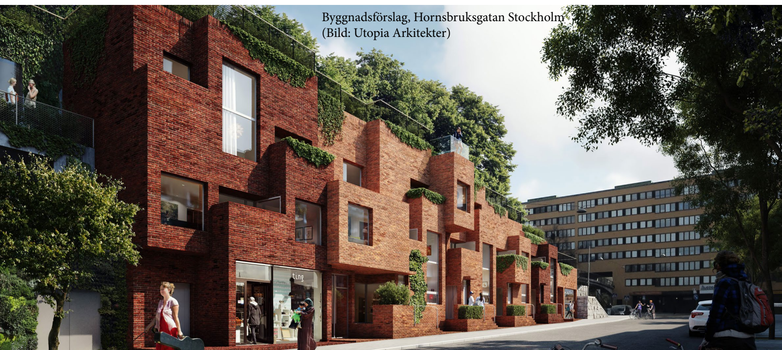
Byggnadsförslag, Hornsbruksgatan Stockholm (Bild: Utopia Arkitekter)

Höjdskillnader kan tas upp med pelare eller suterrängvåningar för att undvika onödig sprängning. En suterränglösning gör att byggnaden på ett naturligt sätt möter topografins olika nivåer.