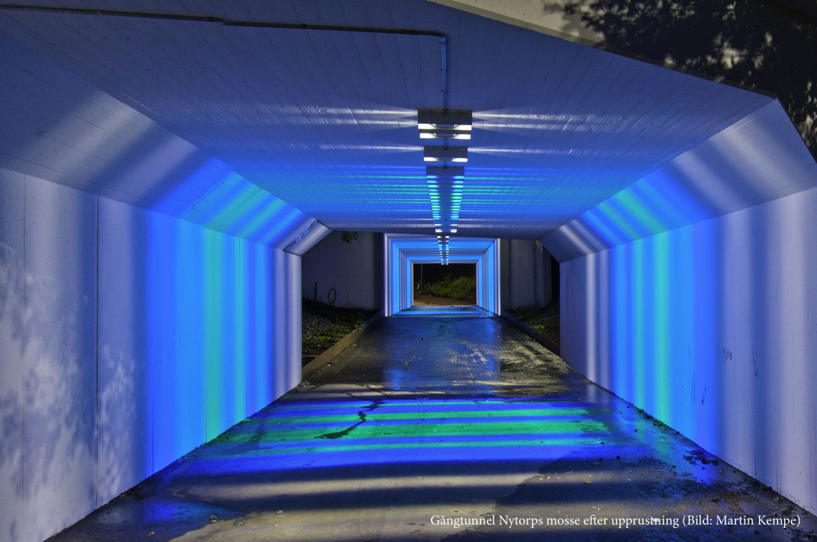
Gångtunnel Nytorps mosse efter upprustning