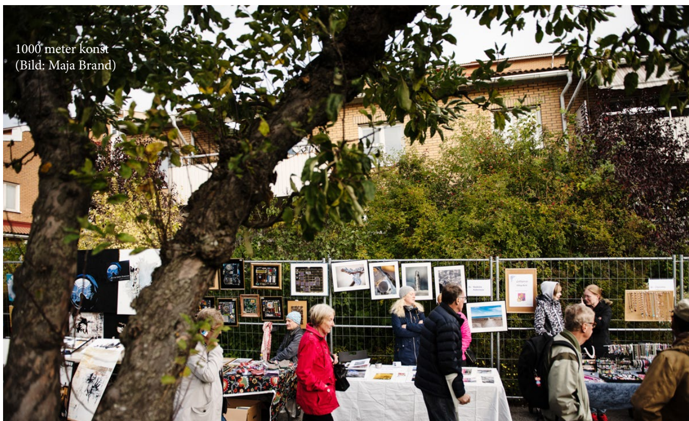
1000 meter konst

Material väljs bland annat för sitt estetiska uttryck, för att det åldras med skönhet och bör kunna rengöras och underhållas. Detaljer såsom entrépartier, fönsterpartier, balkongräcken, och takfötter spelar stor roll för byggnadens estetiska uttryck. Bottenvåningarna är särskilt viktiga eftersom det är i ögonhöjd vi främst uppfattar material och detaljer. Hur byggnaderna avslutas uppåt, det vill säga takets utformning påverkar helheten. Själva taklandskapet kan bidra med variation