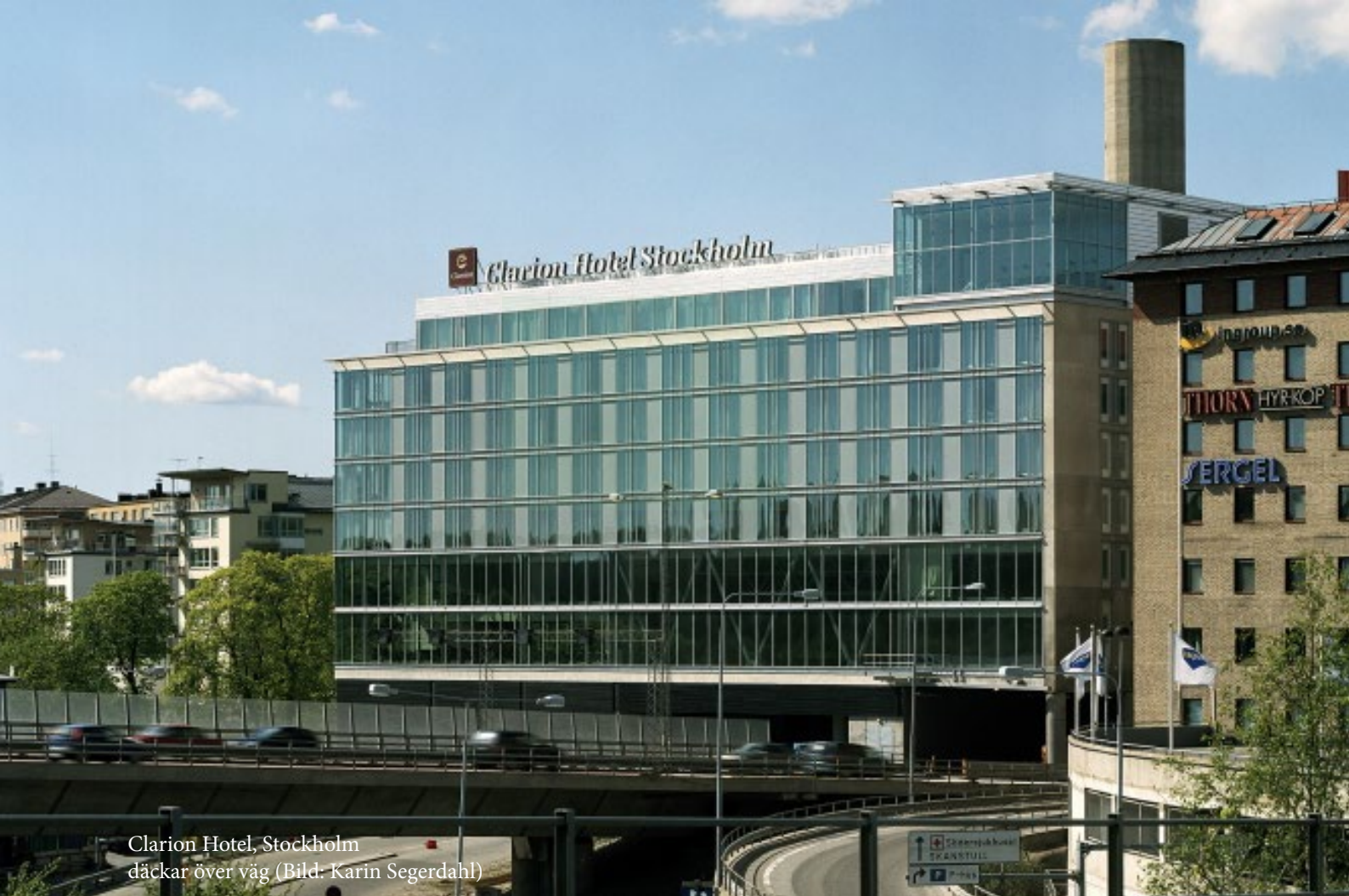
Clarion Hotel, Stockholm däcker över väg