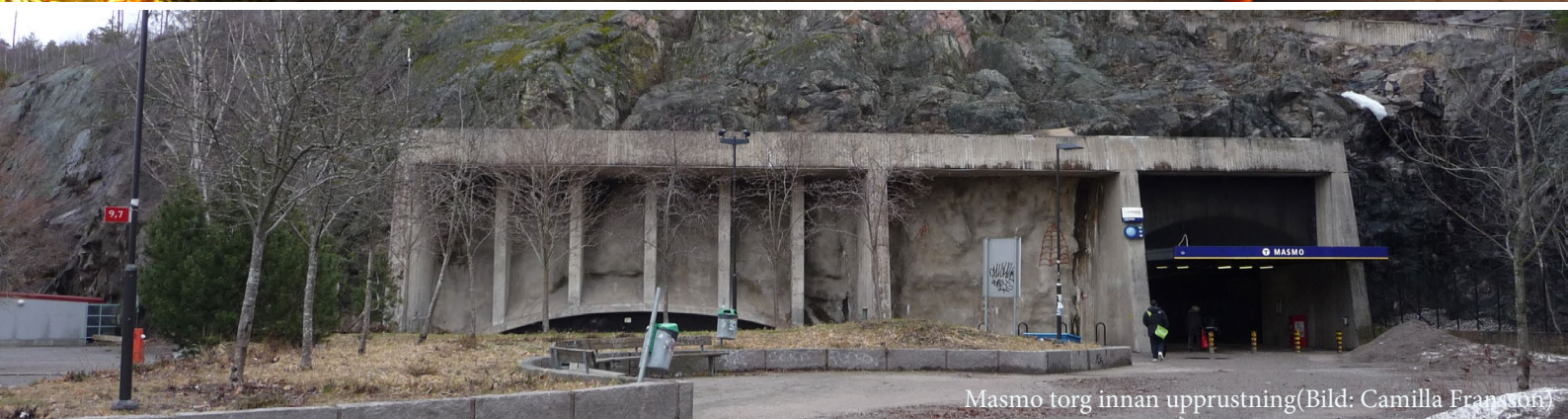
Masmo torg innan upprustning