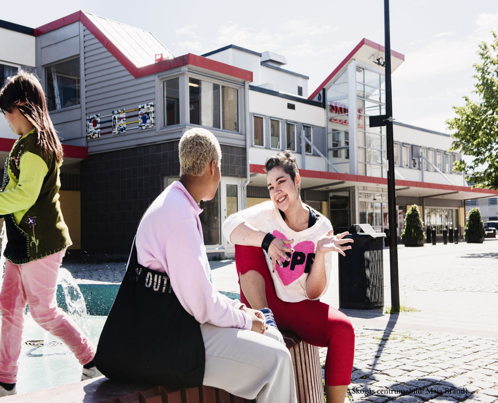
Skogås centrum