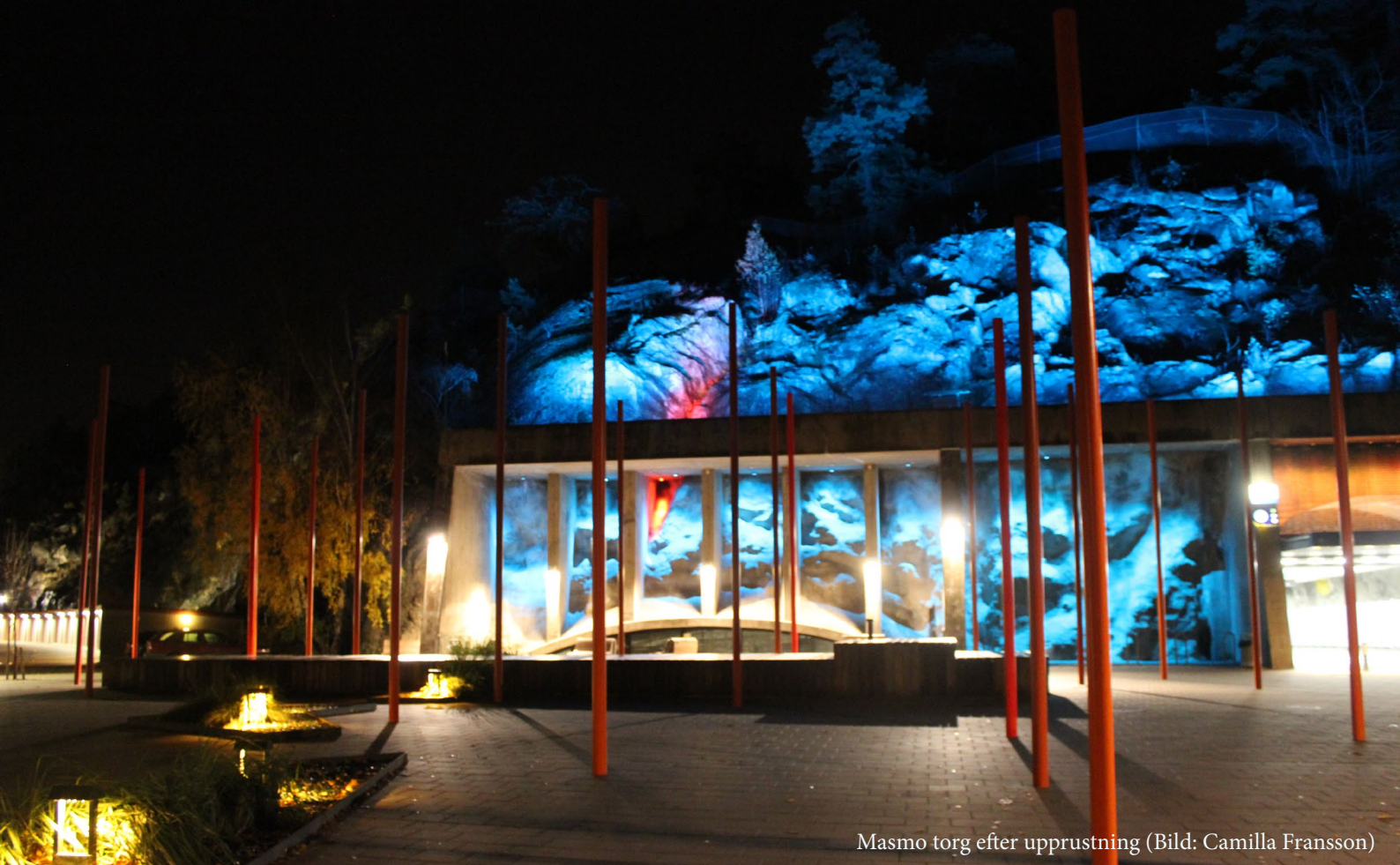
Masmo torg efter upprustning