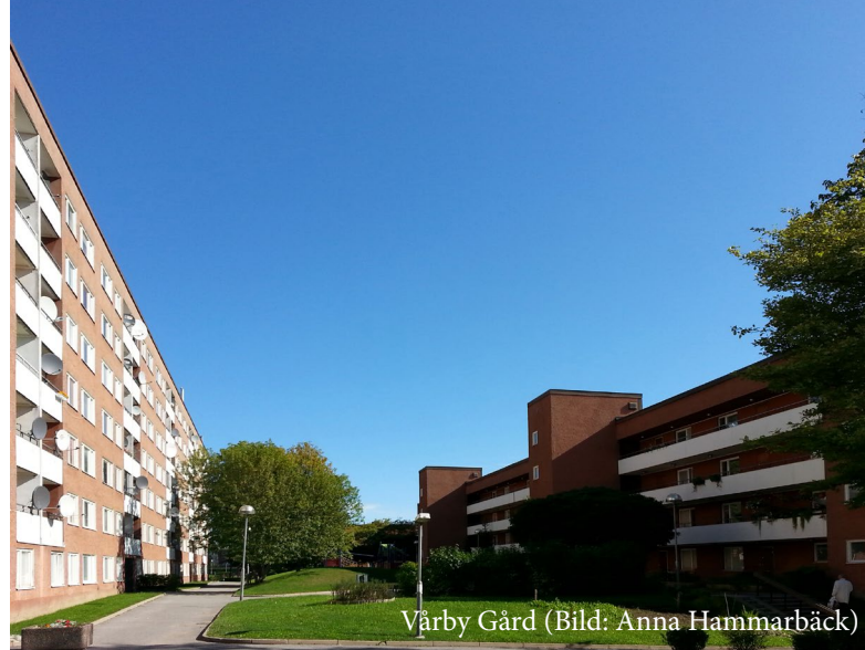
Vårby Gård