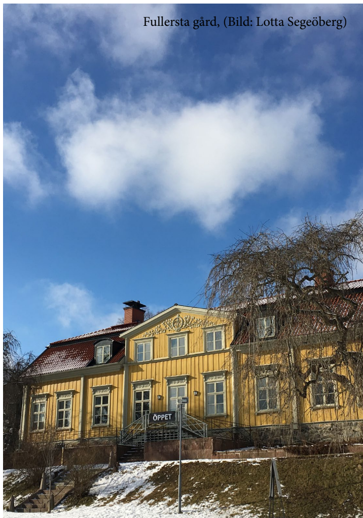
Fullersta gård, (Bild: Lotta Segeöberg)

En god utformning av landskap och byggnation vid kommunens entréer är av strategisk betydelse.