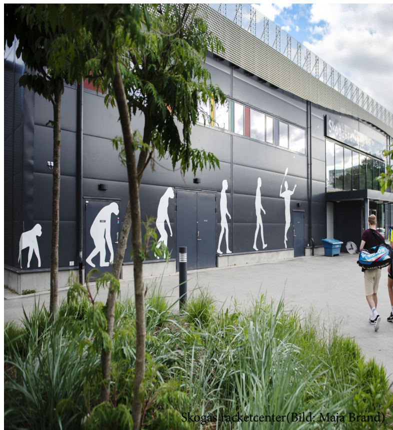
Skogas racketcenter