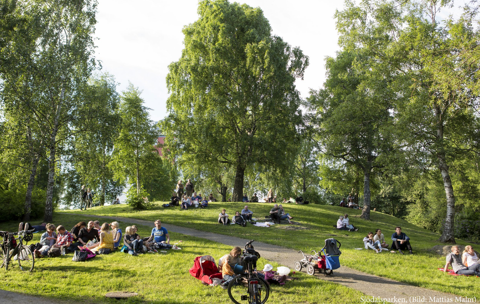
Södalsparken, (Bild: Mattias Malm)