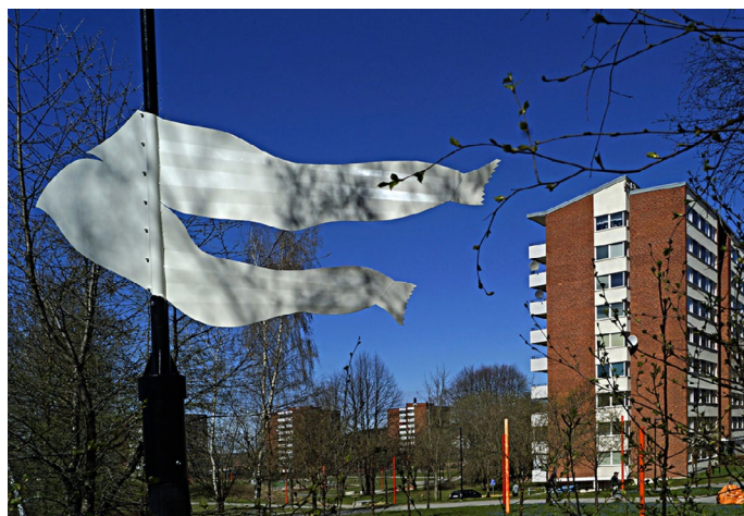
Konstverk och vägvisare till Tvätterimuseet

Begreppet kulturmiljö omfattar hela den av människan påverkade fysiska miljön. Kulturvärden kan i varierande grad tillskrivas enskilda byggnader, anläggningar och lämningar såväl som hela miljöer och stora landskapsavsnitt. Det är inte alltid som bevarande av kulturhistoriskt värdefulla platser och byggnader går hand i hand med den tänkta utvecklingen av ett område. Bevarande vägs till exempel mot behov av fler bostäder, bättre service, förbättrade sociala möjligheter eller en modernisering av verksamheter. Vid stadsutveckling är det viktigt att försöka se kulturmiljön som en resurs till det nya området och inte som ett hinder.