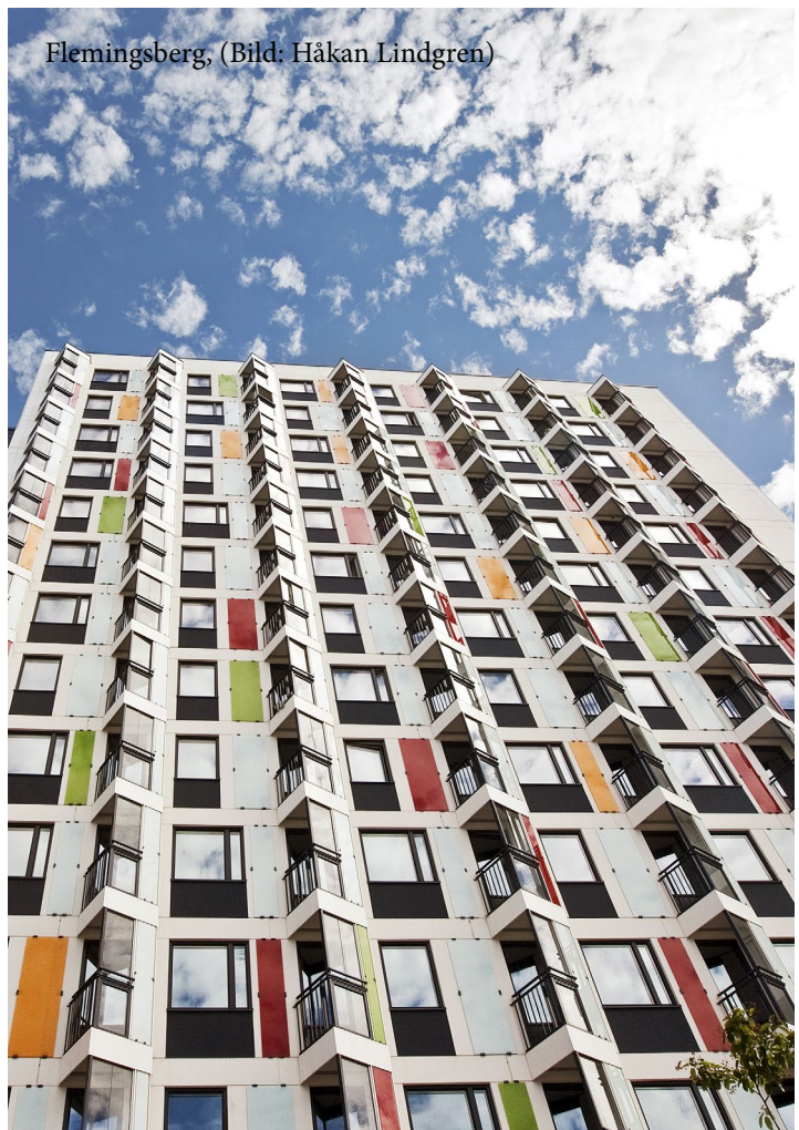
Flemingsberg, (Bild: Håkan Lindgren)