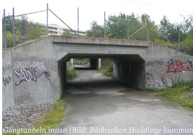
Gångtunneln innan

Uppsikt kring stråk skapas genom att belysa omgivningar och ta bort eller glesa ut kringliggande vegetation.