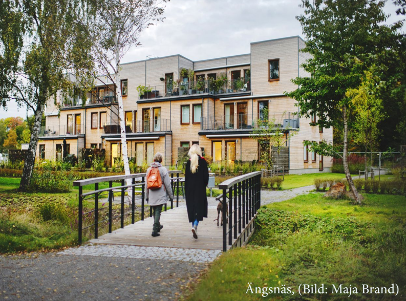
Ängsnäs, (Bild: Maja Brand)