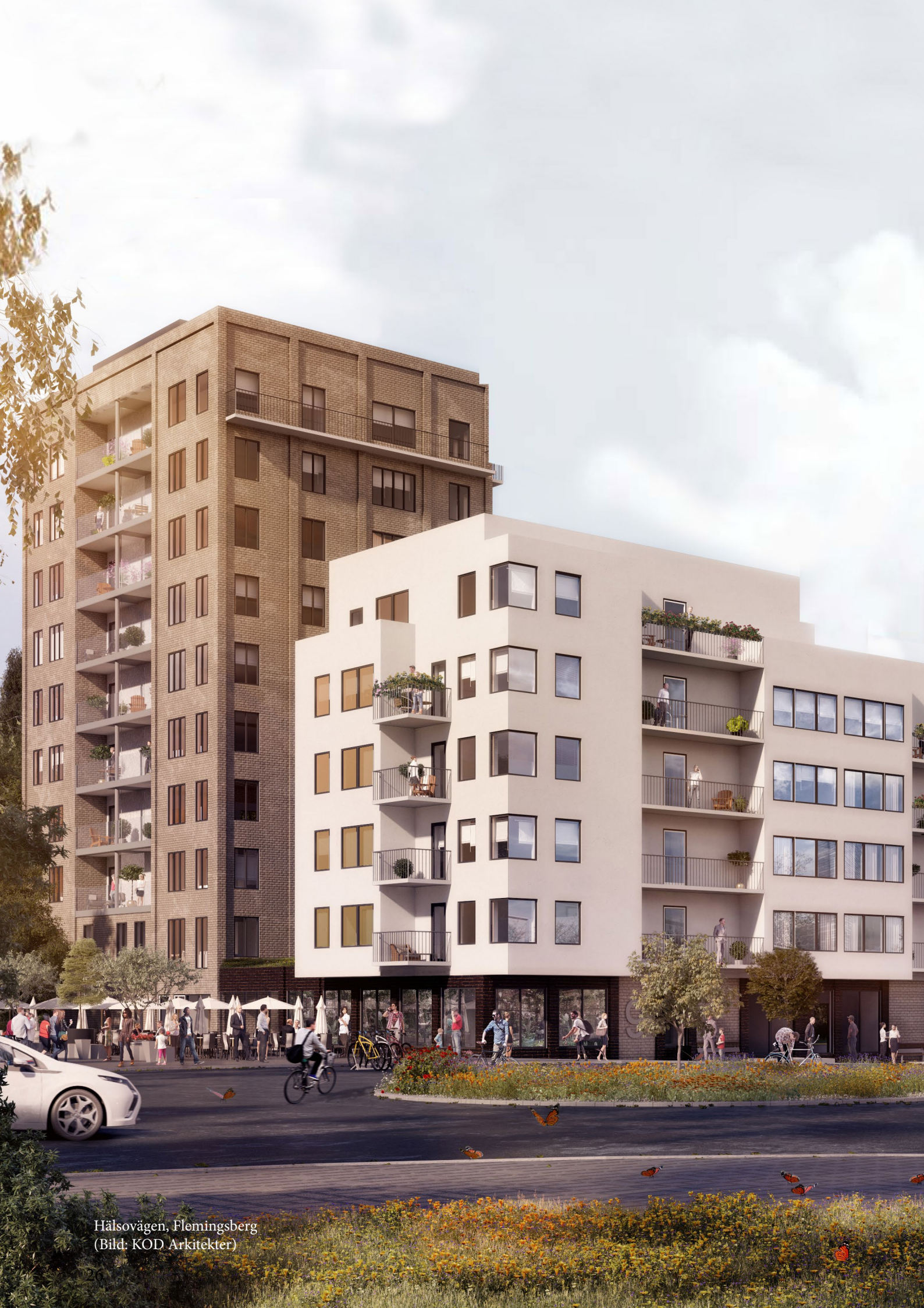
Hälsövägen, Flemingsberg (Bild: KOD Arkitekter)