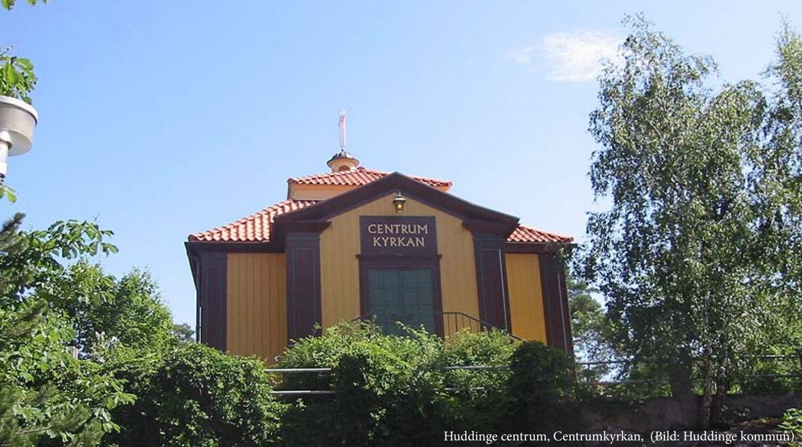
Huddinge centrum, Centrumkyrkan, (Bild: Huddinge kommun)