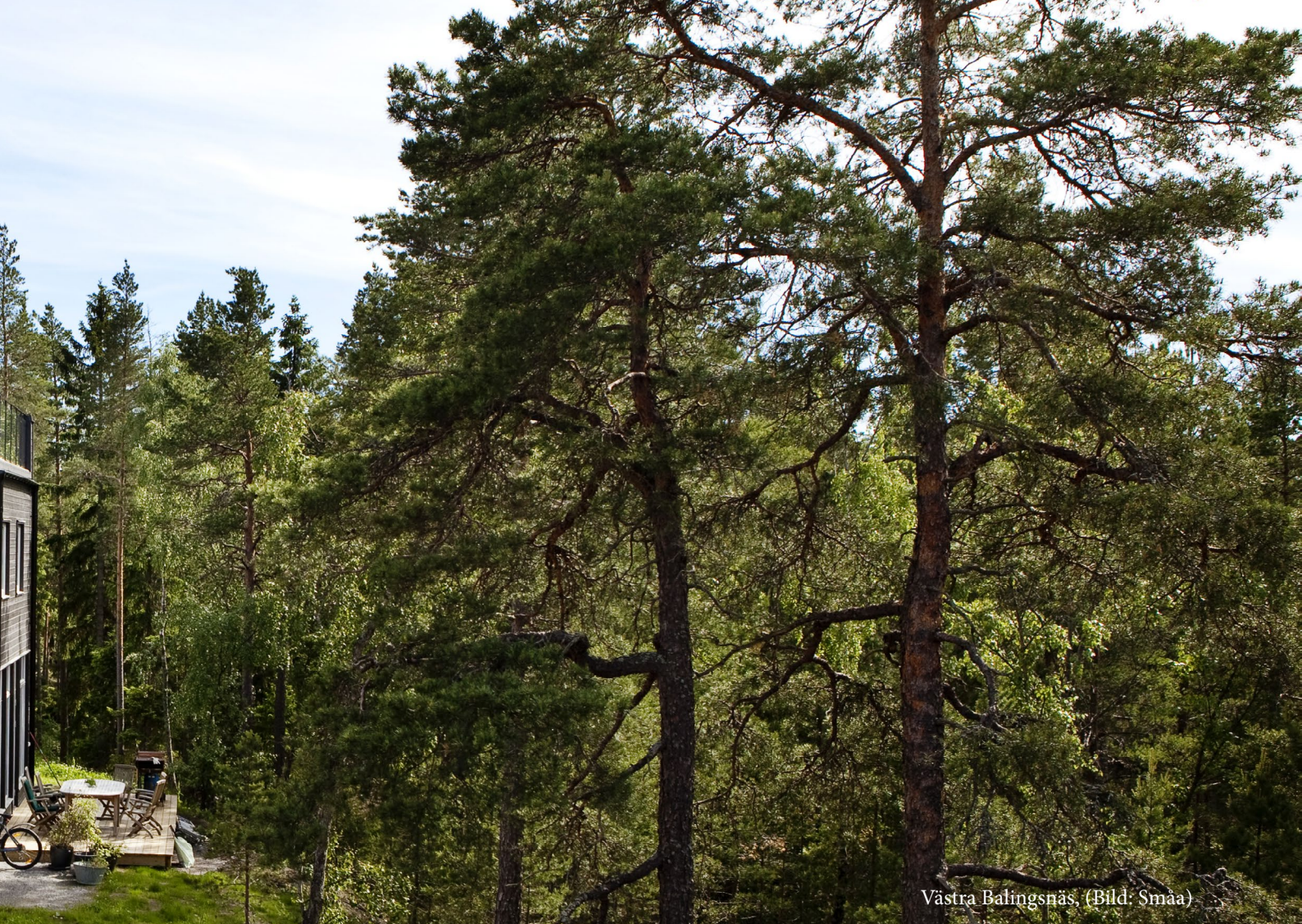
Västra Balingsnäs