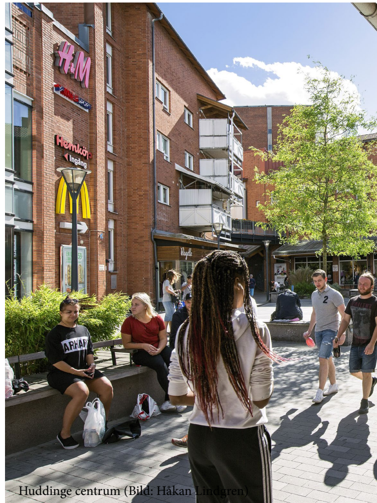
Huddinge centrum

De regionala kärnorna är kommunens största besöksmål och hur dessa uppfattas som stadsmiljöer har stor påverkan på bilden av Huddinge kommun. Utformning och gestaltning av stadsrummen i de regionala kärnorna är strategiskt viktig för kommunens attraktionskraft.