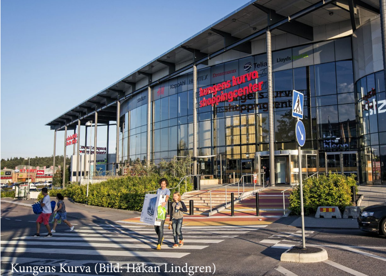
Kungens Kurva