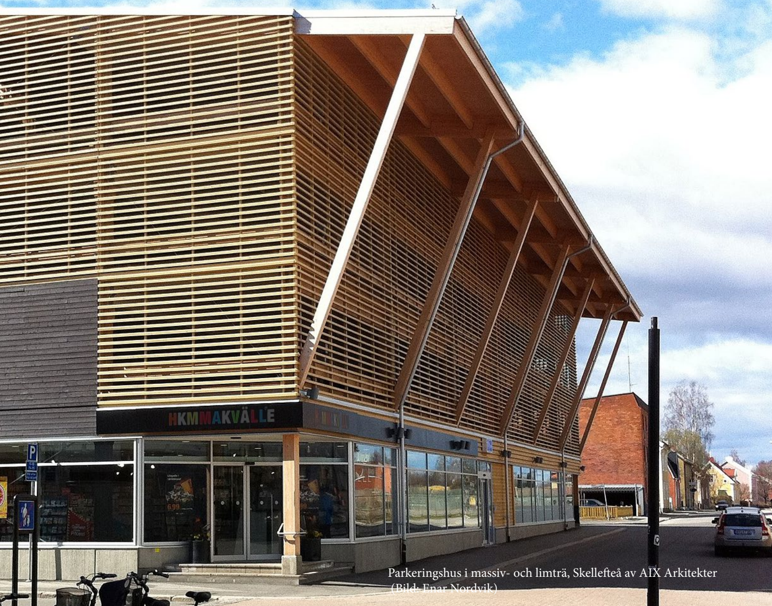
Parkeringshus i massiv- och limträ, Skellefteå av AIX Arkitekter