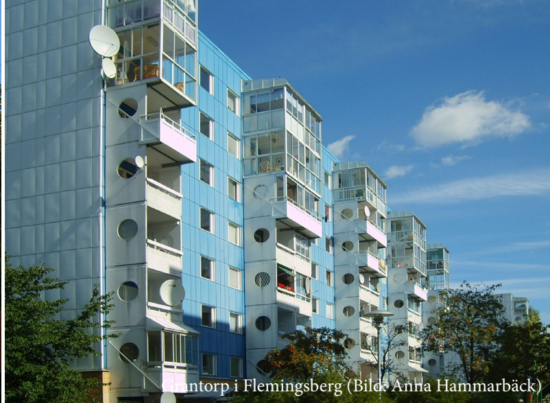
Antorp i Flemingsberg