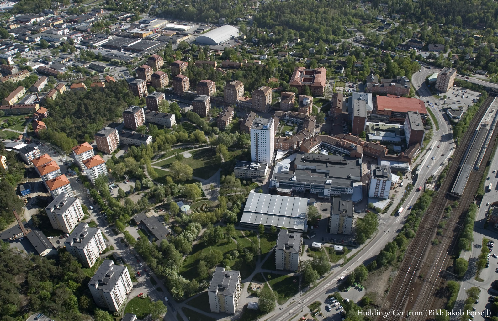
Huddinge Centrum