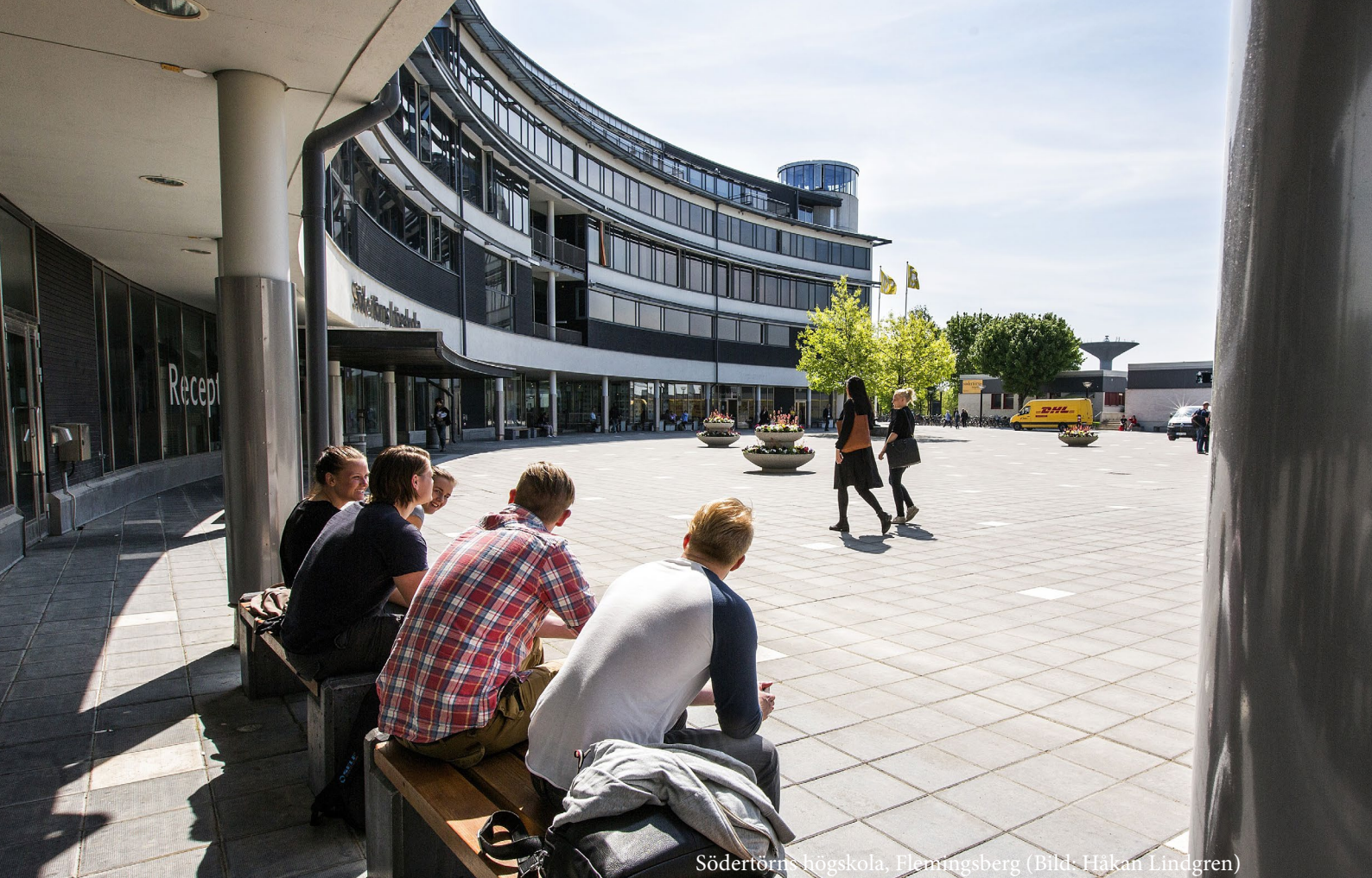
Södertörns högskola, Flemingsberg

och befolkas på terrasser som möter stadsrummet.